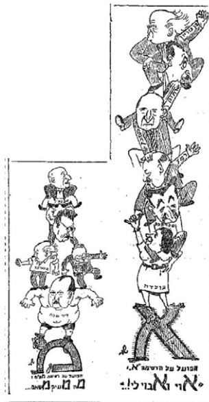
איור 6: קריקטורה נגד מפא"י ומפ"ם. חרות, 14.1.1949, עמ' 4