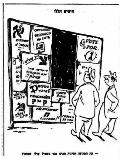
איור 3: הבוחר מול לוח הבחירות במרחב הציבורי. "הימים הללו", הארץ, 14.1.1949, עמ' 5 (נחלת הכלל) 59