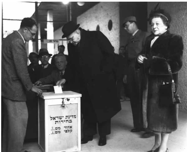
תצלום 2: ד"ר חיים ויצמן, לימים הנשיא הראשון, ורעייתו ורה, מצביעים.