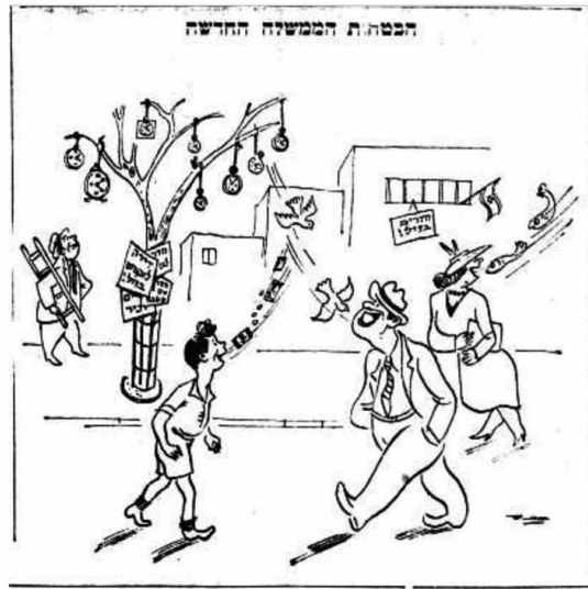
איור 13: הבטחות הממשלה החדשה. הארץ, 11.3.1949, עמ' 3