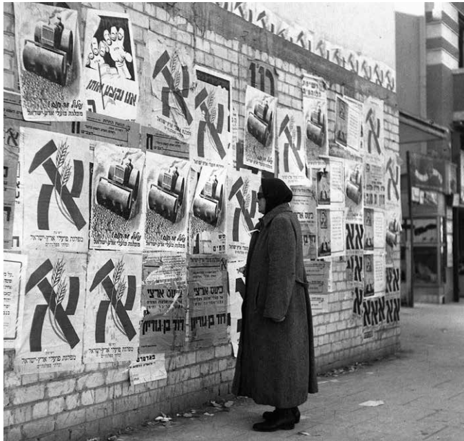
תצלום 1: לוח מודעות במרחב הציבורי.

בה. מחברי לקסיקון לתקשורת הגדירו תעמולת בחירות כ"תהליך שכנועי שמטרתו לחזק או לשנות עמדות והתנהגות של בוחרים לקראת הצבעתם ביום הבחירות" 52 . כיוון שתעמולה היא צורת תקשורת, מתבקש להגדיר מהי תקשורת. דן כספי ויחיאל לימור הגדירו תקשורת כ"אמצעי מתווך עתיק יומין בין השלטון לבין הציבור" 53 . במקרה שלפנינו אמצעי התקשורת שעמדו לרשות המפלגות לצורך תעמולת הבחירות היו דלים יחסית לימינו. יחיעם ויץ הבחין בשלושה מרכיבים עיקריים בתעמולת הבחירות הראשונות לאסיפה המכוננת: מאמרים ומודעות שהתפרסמו בעיתונות המפלגתית "ובאותם ימים היה כמעט לכל המפלגות, גם לקטנות שבהן, עיתון יומי"; מודעות ענק, כרזות ופלקטים שהתנוססו במרחב הציבורי "שנועדו להבליט את נוכחות המפלגות ברחוב"; אספות ועצרות עם שבהן נכח קהל רב של אזרחים, חברי מפלגה ומצביעים פוטנציאליים שהיו, לדעתו, "היעילות ביותר בגיוס מצביעים" 54 . דן כספי וברוך לשם הציעו חלוקה שונה של מרכיבי התעמולה. לדעתם נחלקו דפוסי השימוש באמצעי התקשורת בעשור הראשון ובכלל זה במערכות הבחירות הראשונות, לשלושה תחומים: אמצעי תקשורת בין-אישיים ששימשו באספות עם במרחב הציבורי ובאולמות ציבוריים, במקומות העבודה ובחוגי בית; תקשורת המונים כדוגמת העיתונים שבהם נעשה שימוש רב והרדיו שבו נעשה שימוש מועט; לוחות מודעות ברחובות, משלוח חומר בדואר ורמקולים הוגדרו כאמצעי תקשורת חלופיים. 55