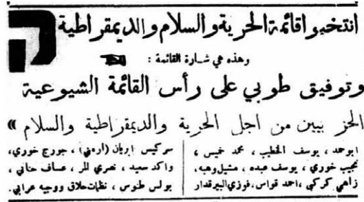
איור 10: מודעת תעמולה בערבית של מק"י [ק], אל-אתיחאד, 10.1.1949, עמ' 1