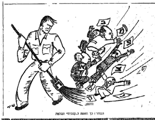
איור 5: קריקטורה נגד מפלגות הקואליציה באסיפת הנבחרים הרביעית. חרות, 21.1.1949, עמ' 5