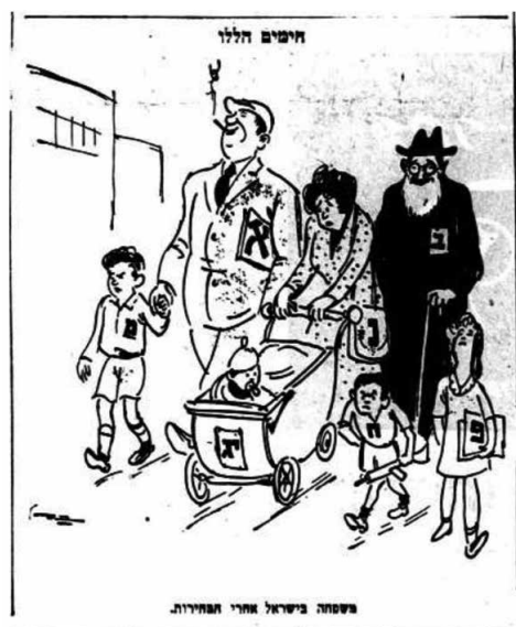
איור 12: קואליציה משפחתית. "הימים הללו", הארץ, 28.1.1949, עמ' 3

ישיבת הפתיחה של האסיפה המכוננת התקיימה ב-14 בפברואר 1949 (ט"ו בשבט תש"ט) 98 . ב-16 בפברואר 1949 שינתה האסיפה המכוננת את שמה ל"הכנסת". ב-10 במארס הוקמה הממשלה הראשונה, שהתבססה על קואליציה בת 73 חברי כנסת, ובה כיהנו 12 שרים בלבד. זו הייתה הממשלה הקטנה ביותר בהיסטוריה של מדינת ישראל. העיתונים בישרו בכותרותיהם על הקמת הממשלה: "ברוב של 73 קולות נגד 43 הביעה אמש הכנסת את אמונה בממשלת ד. בן-גוריון" 99 , "הובע אמון לממשלת בן-גוריון" 100 , "הכנסת הביעה אימון לממשלה ואישרה את תכניתה" 101 , "ממשלת בן-גוריון זכתה ברוב של 28 קול" 102 , "אינצידנטים סוערים בישיבת הכנסת הבוקר" 103 , "ב-73 קולות נגד 45 אושרה הממשלה החדשה" 104 , "הכנסת הביעה אימון לממשלה החדשה" 105 , ו"ברוב קטן הובע אמון לממשלת בן-גוריון" 106 . וכן, כבר בכנסת הראשונה השתתפה מפלגה ערבית בקואליציה וחברי כנסת ערבים נאמו בערבית. ראוי לציין כי כותרות הכתבות בדבר הקמת הממשלה, בחלק מן העיתונים, כדוגמת הארץ, הבקר, חרות ומעריב, למרות הופעתן בעמוד הראשון, לאו דווקא היו המרכזיות באותו העמוד. כותרות הכתבות שבישרו על כיבוש הנגב, מבאר שבע ועד אילת, וחבל סדום הן שהובלטו.