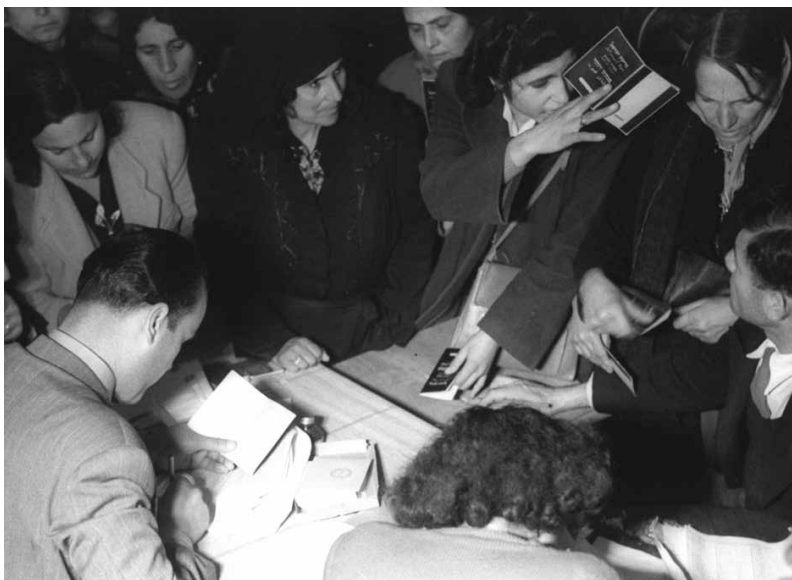
תצלום 3: קלפי בנצרת.