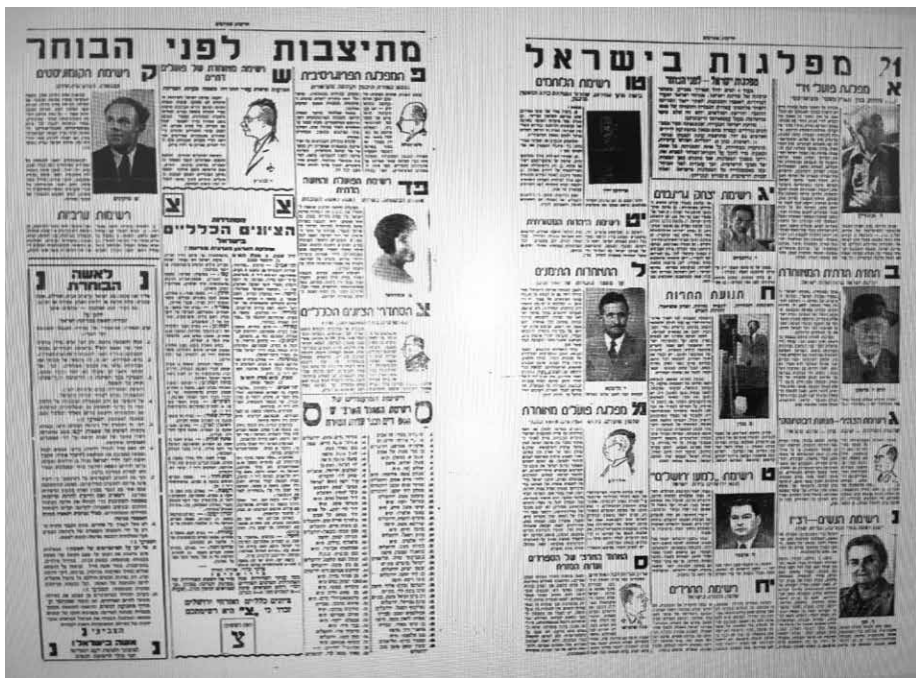
איור 2: "21 מפלגות בישראל מתיצבות לפני הבחור". כותרת בעיתון ידיעות אחרונות, 21.1.1949, עמ' 4-5 46

בהארץ נכתב כי אושרו 21 רשימות ובהן 1,340 מועמדים הנאבקים על 120 המקומות באסיפה המכוננת. 47 בדבר היו הנתונים שונים במקצת. העיתון מסר לקוראיו בכתבה שכותרתה הייתה "22 רשימות אושרו", כי הוגשו עשרים רשימות הכוללות שלוש רשימות ערביות, ומספר המועמדים בכל הרשימות עומד על 1,288. בפועל בגוף הכתבה מופיעות 21 רשימות. 48 כך או אחרת, 21 מפלגות ניגשו לבחירות הראשונות.